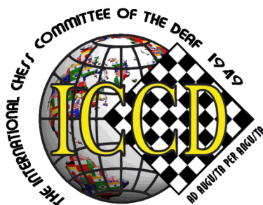
Le logo de l'ICCD

Actuellement, l'organisation vient de lancer un recensement pour connaître les d'écoles spécialisées pratiquant le jeu ceci dans le but d'obtenir des financements, en particulier de la FIDE (Chess in Schools Project).